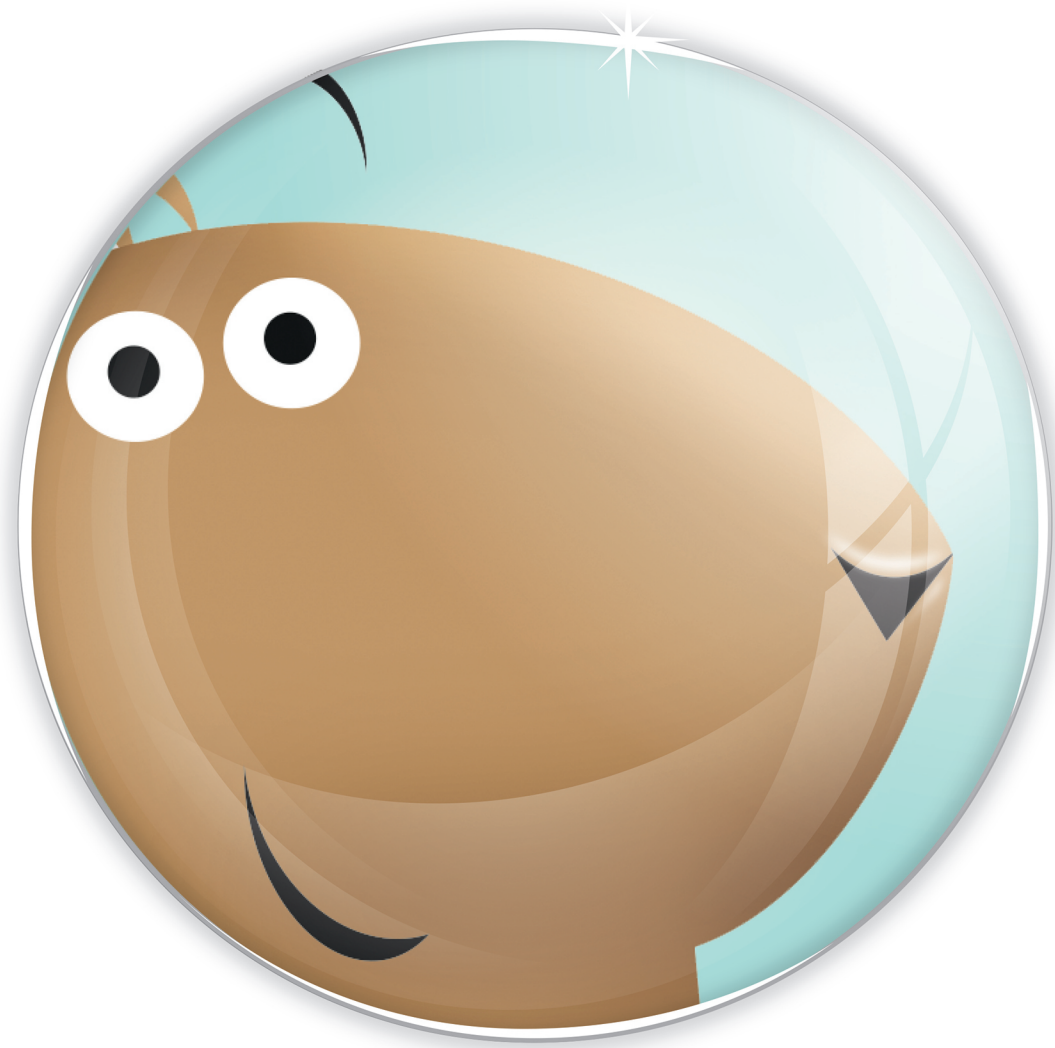
nariz de cacahuete.