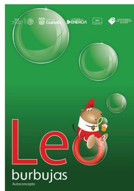
Ilustración de portada e interiores: Diseñada en base a vectores

Distribución gratuita/Prohibida su venta